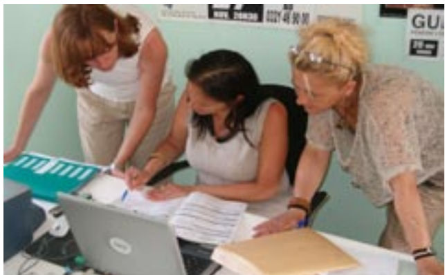
L'atelier multimédia permet de mieux maîtriser l'informatique