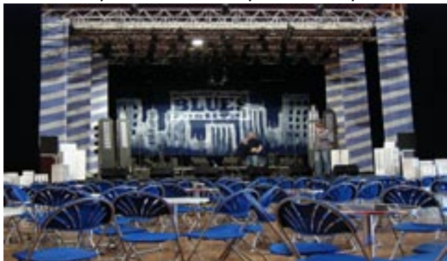
L'atelier déco a personnalisé les scènes.

Les Ateliers de la citoyenneté visent et favorisent la réinsertion de personnes en quête d'emploi, dans un contexte d'obligations professionnelles.